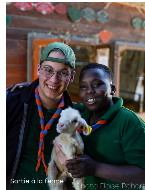
Sortie à la ferme

“ Je ne pensais pas que nous serions dans un si bel endroit, merci ! une maman en séjour famille ”