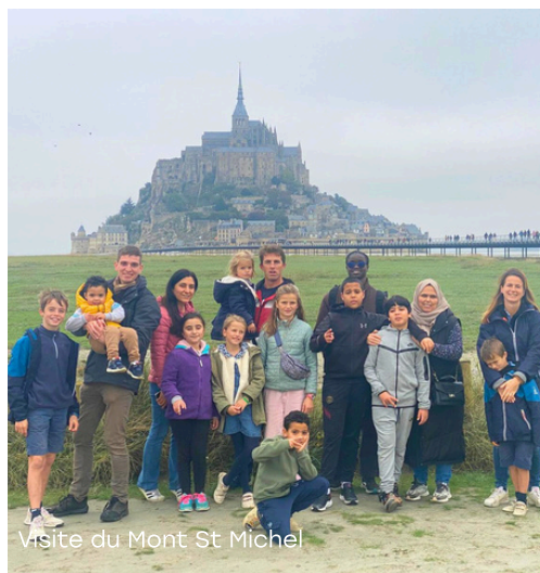
Visite du Mont St Michel

En juin, chaque enfant suivi à l'accompagnement à la scolarité a reçu un diplôme ainsi qu'une qualité que l'équipe avait particulièrement remarquée chez lui. Quelle fierté pour chacun de s'avancer devant tout le monde pour recevoir ces distinctions !