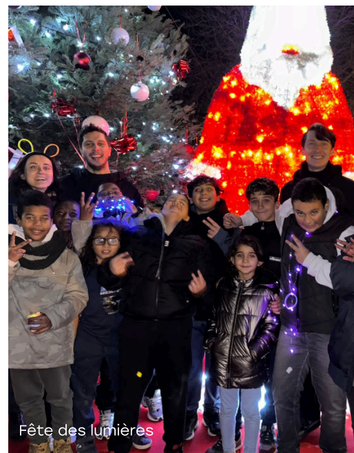
Fête des lumières

“ Le Rocher c'est comme une famille, ils sont là dans les bons moments comme dans les moments difficiles. Nana