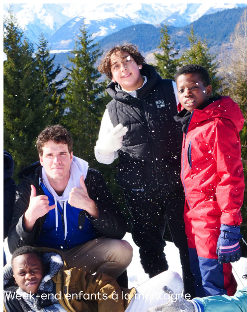
Week-end enfants à la montagne

3 jeunes retraités ont rejoint l'antenne et donnent plus de 3 jours par semaine : autant de ressources appréciées et de présences durables pour nouer des relations profondes avec les habitants.