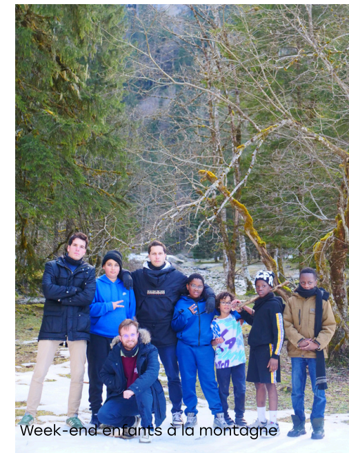
Week-end enfants à la montagne