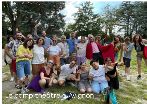
Le camp théâtre à Avignon

A Nîmes nous avons la chance de vivre dans une région au patrimoine culturel exceptionnel. Certains samedis, nous organisons des sorties à Nîmes pour explorer des lieux emblématiques comme le musée de la Romanité, les Arènes, le Musée des Beaux-Arts, Uzès, Aigues-Mortes, Sainte Marie de la mer, mais aussi Marseille, les Baux-de-Provence, Saint-Rémy-de-Provence... Cette richesse culturelle est une véritable invitation à découvrir l'histoire de notre territoire, et c'est une joie de partager ces moments avec les habitants.