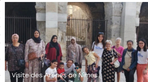
Visite des Arènes de Nîmes