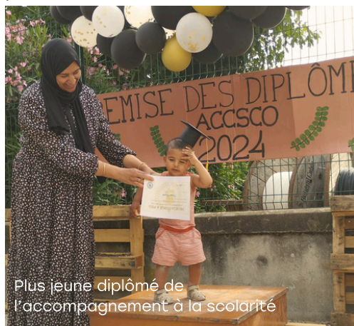
Plus jeune diplômé de l'accompagnement à la scolarité

Tout au long de l'année nous accueillons en lien avec l'École de la Deuxième Chance des stagiaires permettant à des jeunes issus des quartiers de confirmer ou non un projet professionnel.