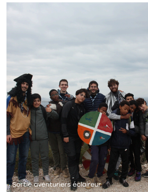
Sortie aventuriers éclaireur