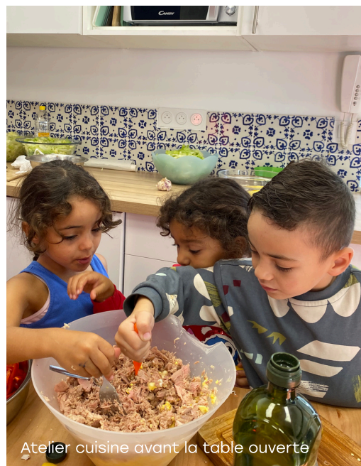
Atelier cuisine avant la table ouverte