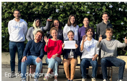
Equipe de Marseille

Les ateliers de français réunissent chaque semaine de nombreux habitants désireux d'apprendre et de progresser en français. En complément de ces cours, nous avons eu la chance de faire des sorties pour apprendre autrement dont une au Musée d'Histoire Naturelle de Marseille. Une parfaite occasion de continuer à nouer du lien.