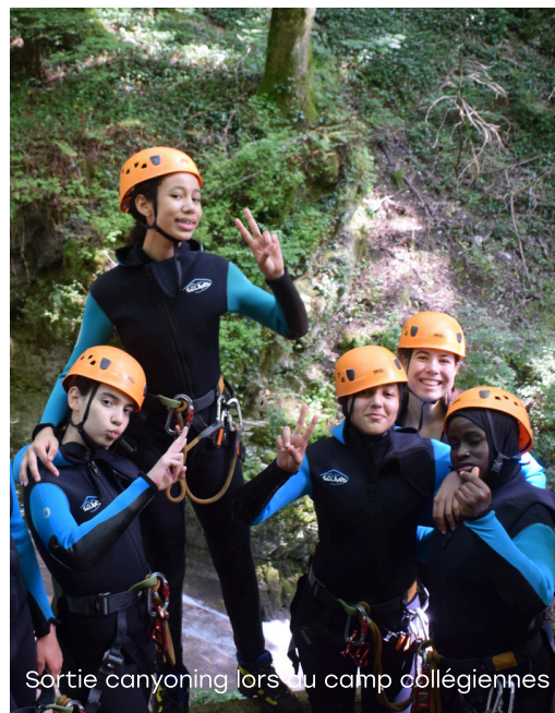
Sortie canyoning lors du camp collégiennes