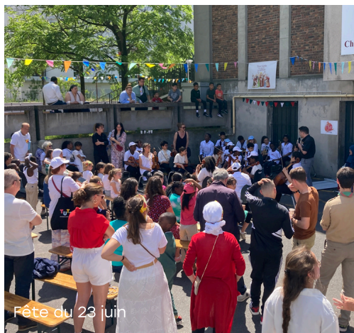
Fête du 23 juin