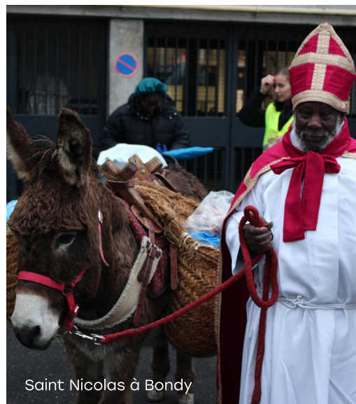
Saint Nicolas à Bondy