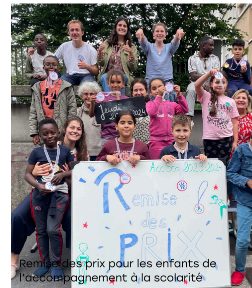
Remise des prix pour les enfants de l'accompagnement à la scolarité